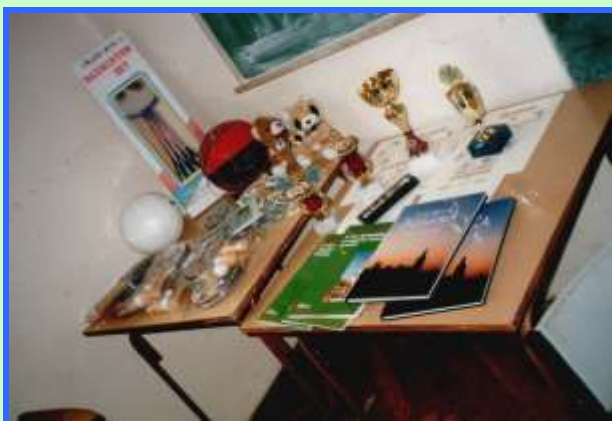
Nagrody XIV Międzynarodowego Turnieju Szachowego Przemyskiego Niedźwiadka