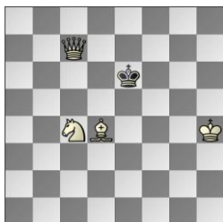
I – Karol Wojtyła 4 marca 1946