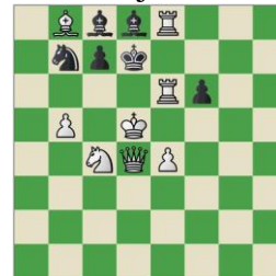
IV Karol Wojtyła maj 1946