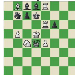
IV Karol Wojtyła maj 1946