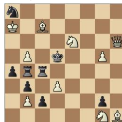
III Karol Wojtyła RSK, kwiecień 1946